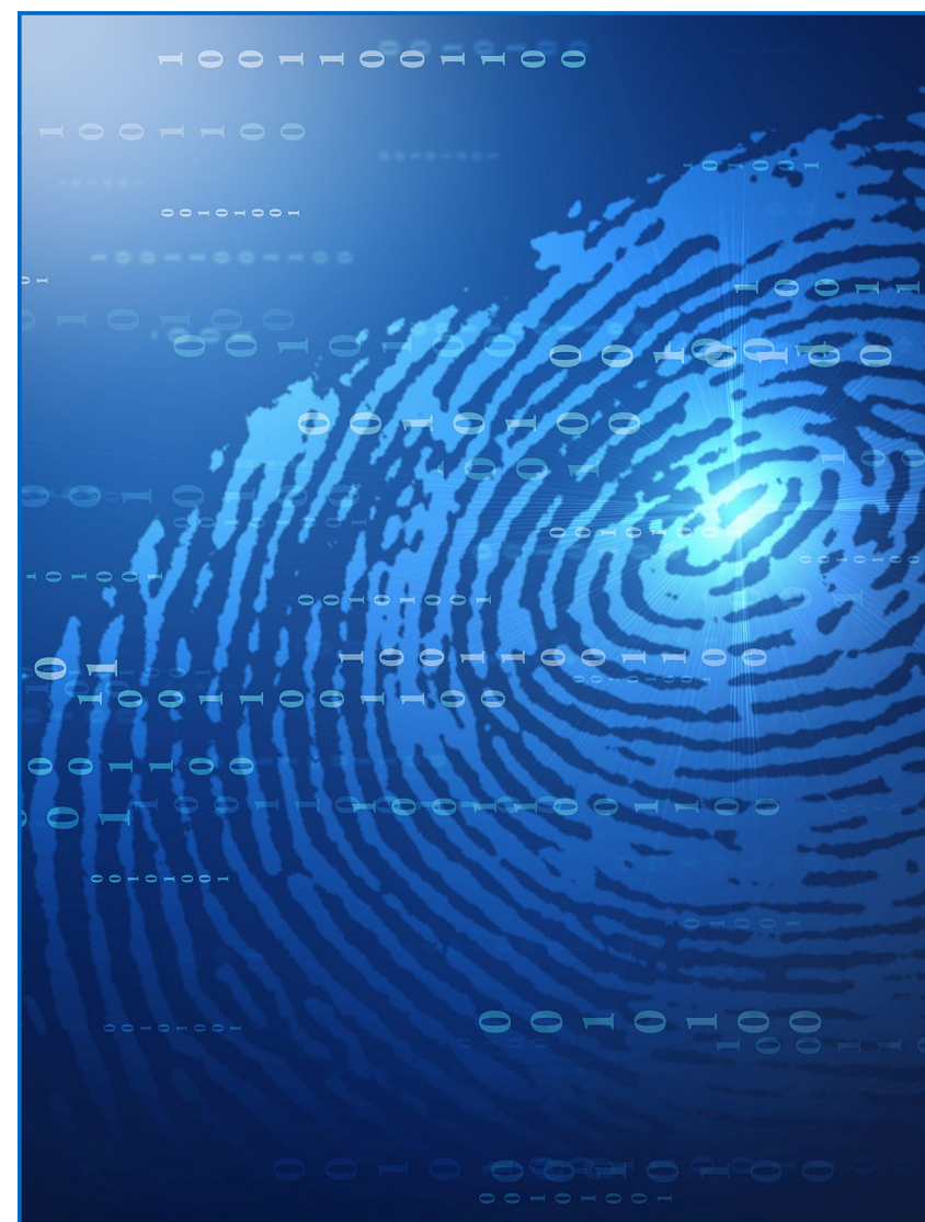
图 3：验证是数据迁移至关重要的环节

除了验证源 LUN 与目标 LUN 是完全相同的副本外，您还需要根据 IMT 验证主机、交换机和 ONTAP 阵列属于受支持的配置。