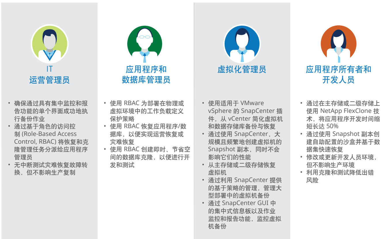
图 2) 通过自助服务功能和 RBAC 扩大 IT 专业人员的能力范围。