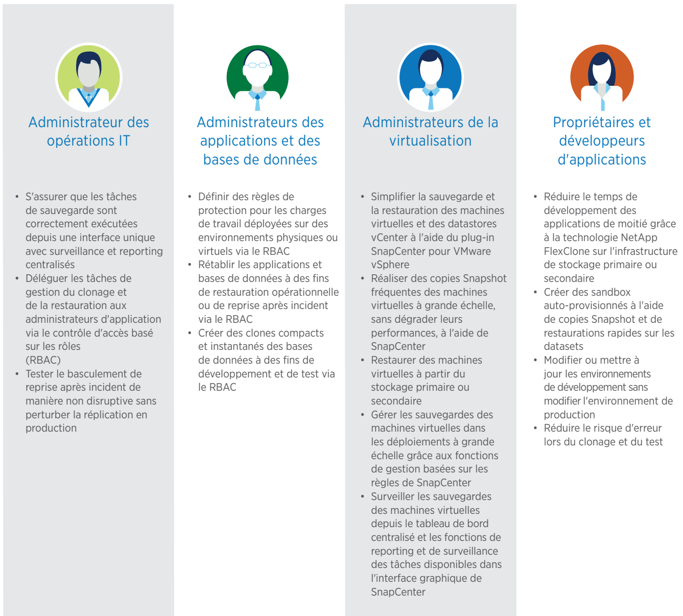
Figure 2) Les spécialistes IT ont accès à des fonctionnalités en libre-service et au contrôle d'accès basé sur les rôles.