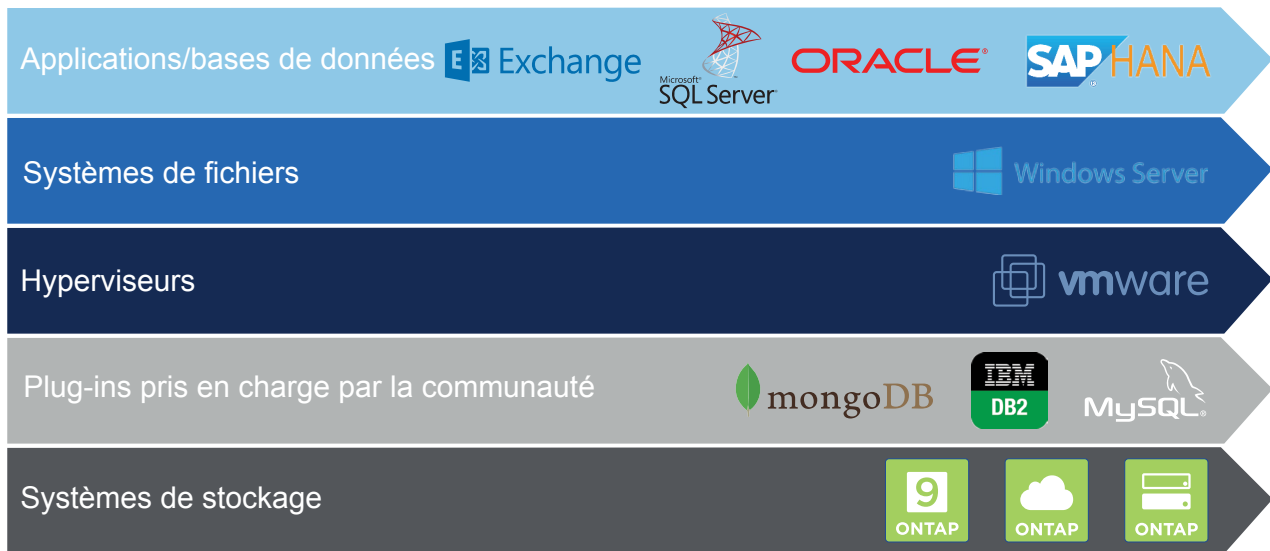
Figure 1) NetApp fournit des options de déploiement flexible et de support complet. Consultez la matrice d'interopérabilité (IMT) NetApp pour connaître les versions logicielles prises en charge.

SnapCenter inclut SnapCenter Server ainsi que des plug-ins d'application, de base de données et de système d'exploitation légers, qui sont contrôlés depuis une console de gestion centrale. SnapCenter Server inclut également une fonction de gestion Snapshot pour faciliter la restauration des copies instantanées.