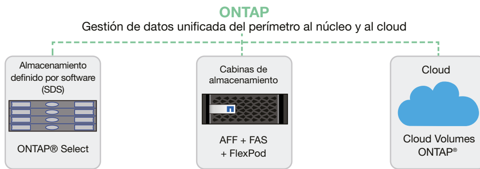
Figura 1) Estandariza la gestión de datos en distintas arquitecturas con un amplio conjunto de servicios de datos empresariales.